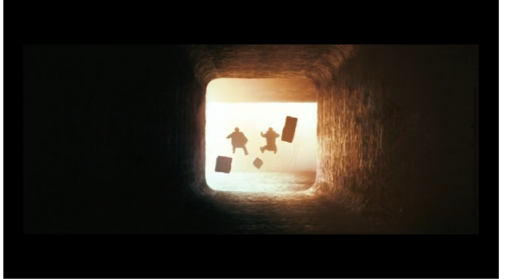
Şekil 3. Video Makale

Çekimde soft focus ve düşük ışık sepya filtre kullanılarak geleceğe yönelik görüntüler geçmiş gibi okunur. Bu kesme boyunca Louise gelecekteki, henüz doğmamış ve paradoksal olarak çoktan ölmüş olan Hannah'ya ne olacağına görür. Yazarlara göre bunu basit bir flashforward olarak açıklamak filmin karmaşık zaman kullanımını yanlış okumak anlamına gelir. Biçimsel düzlemde çalışmanın bu bölümünde zaman bombası sekansı iki planda tanıtıldıktan sonra filmde çapraz kesmeyle birbiri ardına verilen görüntüler video makale/denemede bölünmüş çerçevede aynı anda izlenmektedir. Loise'nin doğrusal zamanı kıran deneyimi zaman bombasının patlama anının çalışmada hareketin tersten okutulması ve kullanılan ara yazılarla vurgulanmıştır.